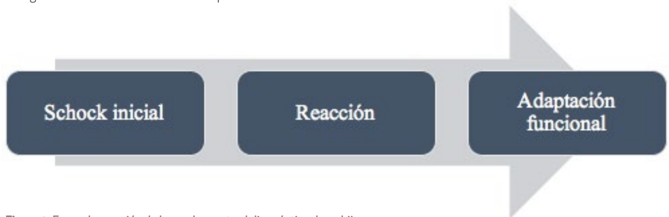
Figura 2. Fases de reacción de los padres ante el diagnóstico de su hijo.

de diagnóstico es un punto crítico, especialmente para los padres, los cuales pasan por una serie de etapas que van desde una fase de shock inicial, caracterizada por la incredulidad y la conmoción; seguida de un periodo de reacción, en la que se experimentan una amplia gama de sentimientos como la necesidad de protección del niño o resentimiento-culpabilidad, ansiedad e incompetencia, entre otros; hasta finalmente, la fase de adaptación funcional (Lozano y Pérez, 2000).